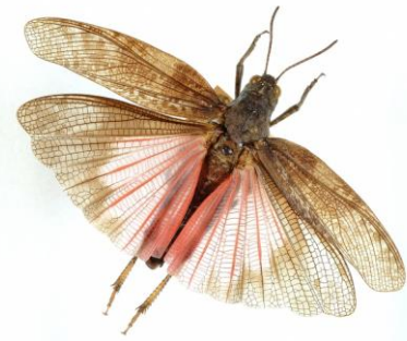
Die Schnarrschrecke ist das Wahrzeichen des Freundeskreis Dr. Heinz Fischer Sammlungen e.V.