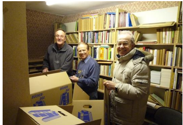
Viele helfende Hände unterstützen die Neugestaltung der Dr. Heinz Fischer Sammlungen