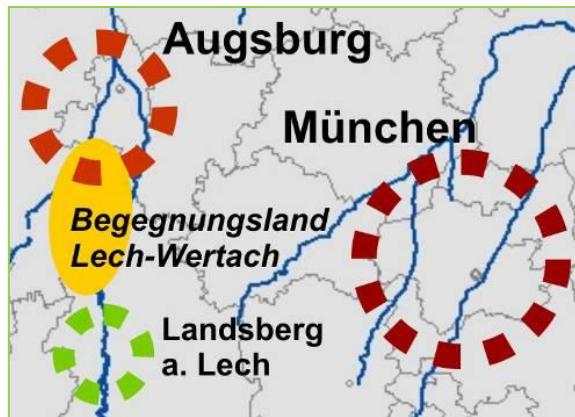
Abbildung 2: Lage zwischen den Ballungsräumen

„bottom-up“-Prinzip im besonderen Maße, da hier nicht aufgrund politischer Grenzen, sondern anhand realer Bedarfe ein Raum gebildet wird. Die Mitgliedskommunen sind gemeindeübergreifend durch ähnliche Herausforderungen gekennzeichnet, welche die Lage zwischen Augsburg und Landsberg am Lech sowie die Nähe des Ballungsraums München mit sich bringen und einer besonderen Anpassungsfähigkeit und Widerstandsfähigkeit